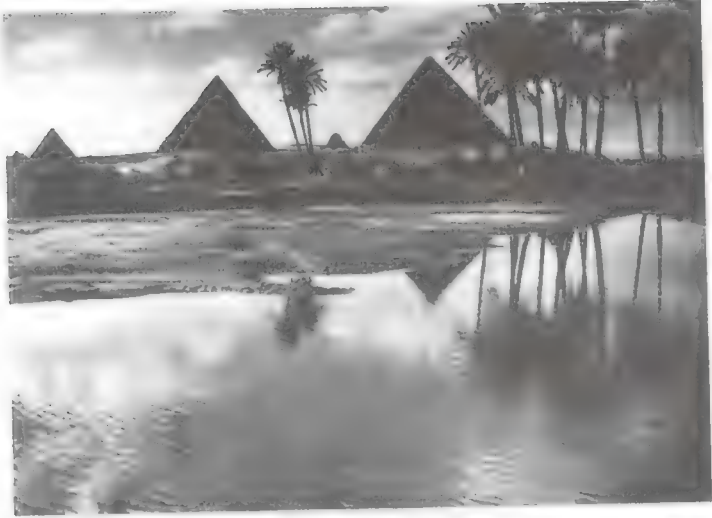
انحسار الفيضان أمام الأهرام الثلاثة بالجيزة عام ١٩٢٦